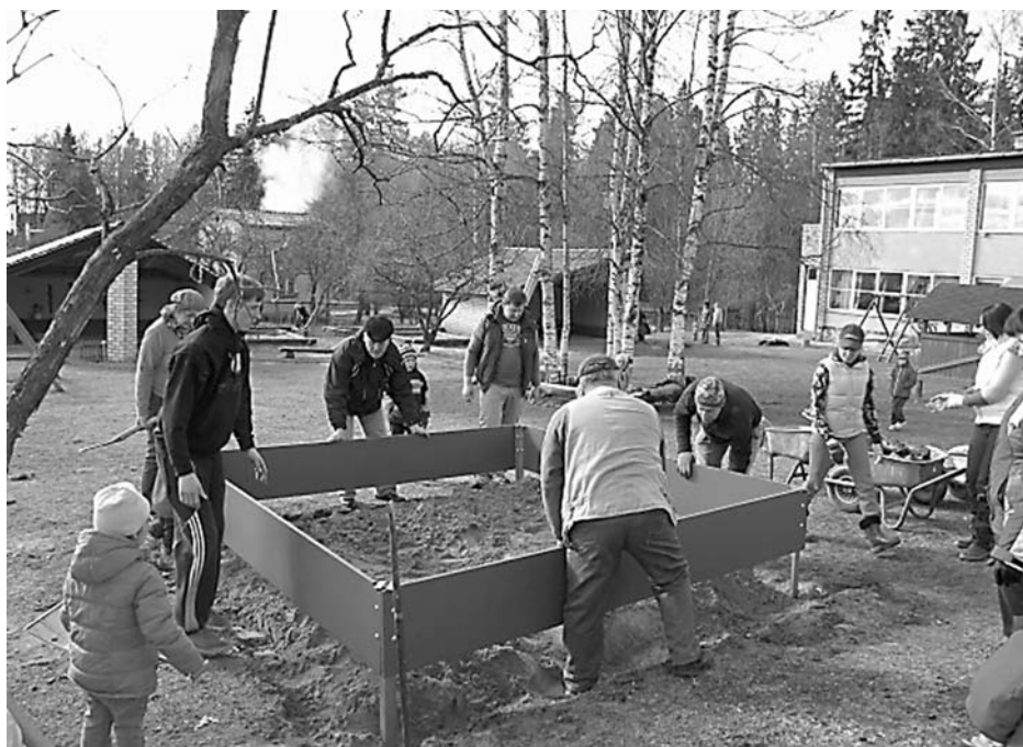
Čakli talkoja arī bērnu dārza „Mežmalīņa” bērni, vecāki un darbinieki, labiekārtojot bērnu dārza teritoriju

Saku lielu paldies visiem talkotājiem Liepā, Mārsnēnos, Piekuļos, Veselavā mēs esam sakopuši kādu vietu lielajā, plašajā pasaulē, ko mēs saucam par savām MĀJĀM.