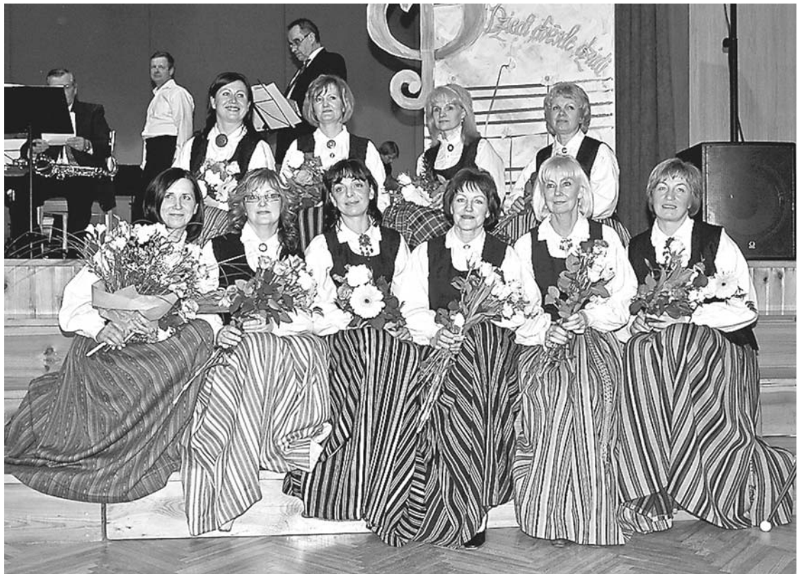
Ansamblis „Noskaņa” pēc jubilejas koncertā