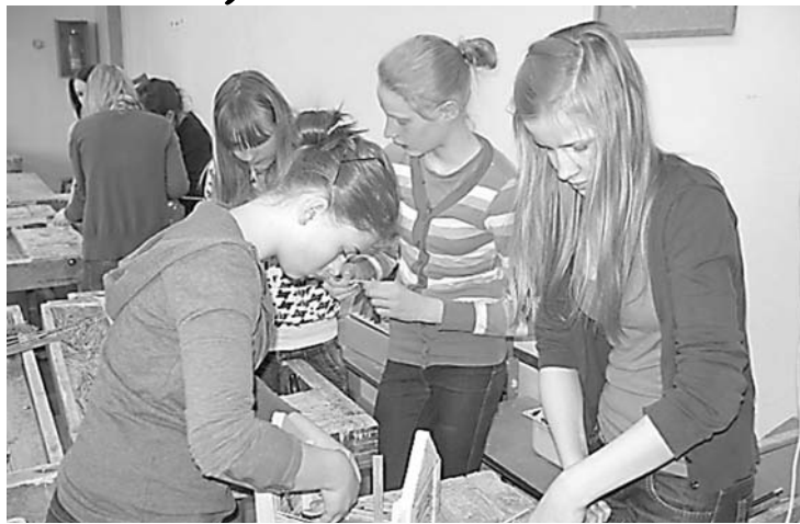
Darbnīcās top projektu darbi

Gan skolēni, gan skolotāji, izvērtējot šo dienu norisi, atzina, ka